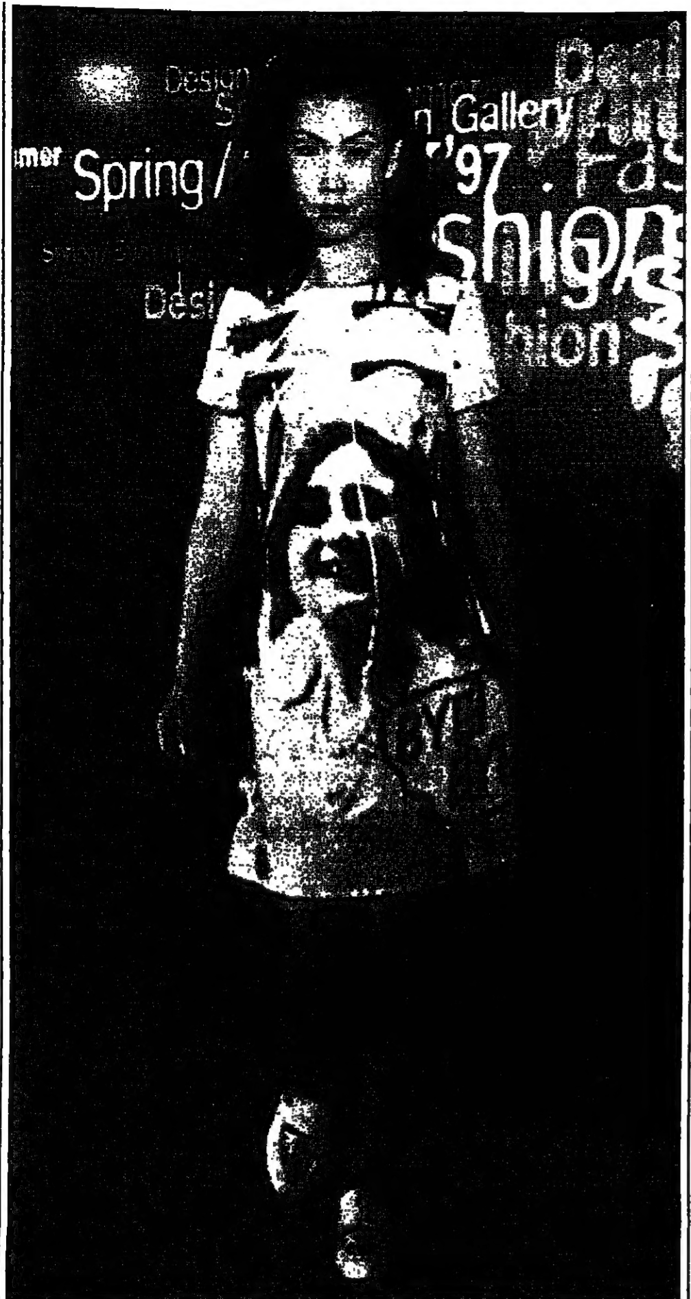
صورة للملكة البريطانية الراحلة في شياها مطبوعة على تصميم جديد في معرض الأزياء الذي أقيم في مركز كورنغ اس